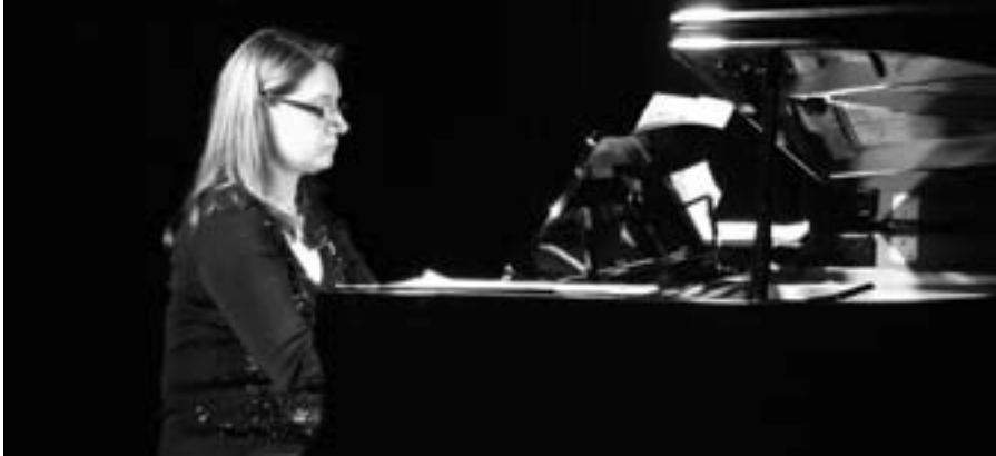
De dalt a baix, Ma-