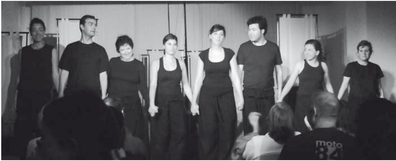
A l'esquerra, full volant convidant a la festa que va organitzar l'Ateneu Popular a la Plaça Major. A la dreta, una reunió Centre Social Okupat de L'Esquerda. A sota, actors i actrius de l'Elenc Teatral J. V. Foix.

i combatiu, continuen vives dins nostre.. Així per exemple la Cooperativa Germinal ja ha trobat un nou espai (al carrer Pedró de la Creu), on desenvolupar la seva activitat i de ben segur que el col·lectiu de l'Ateneu seguirà present i removevent consciències per les places i carrers de la nostra Vila. Salut!"