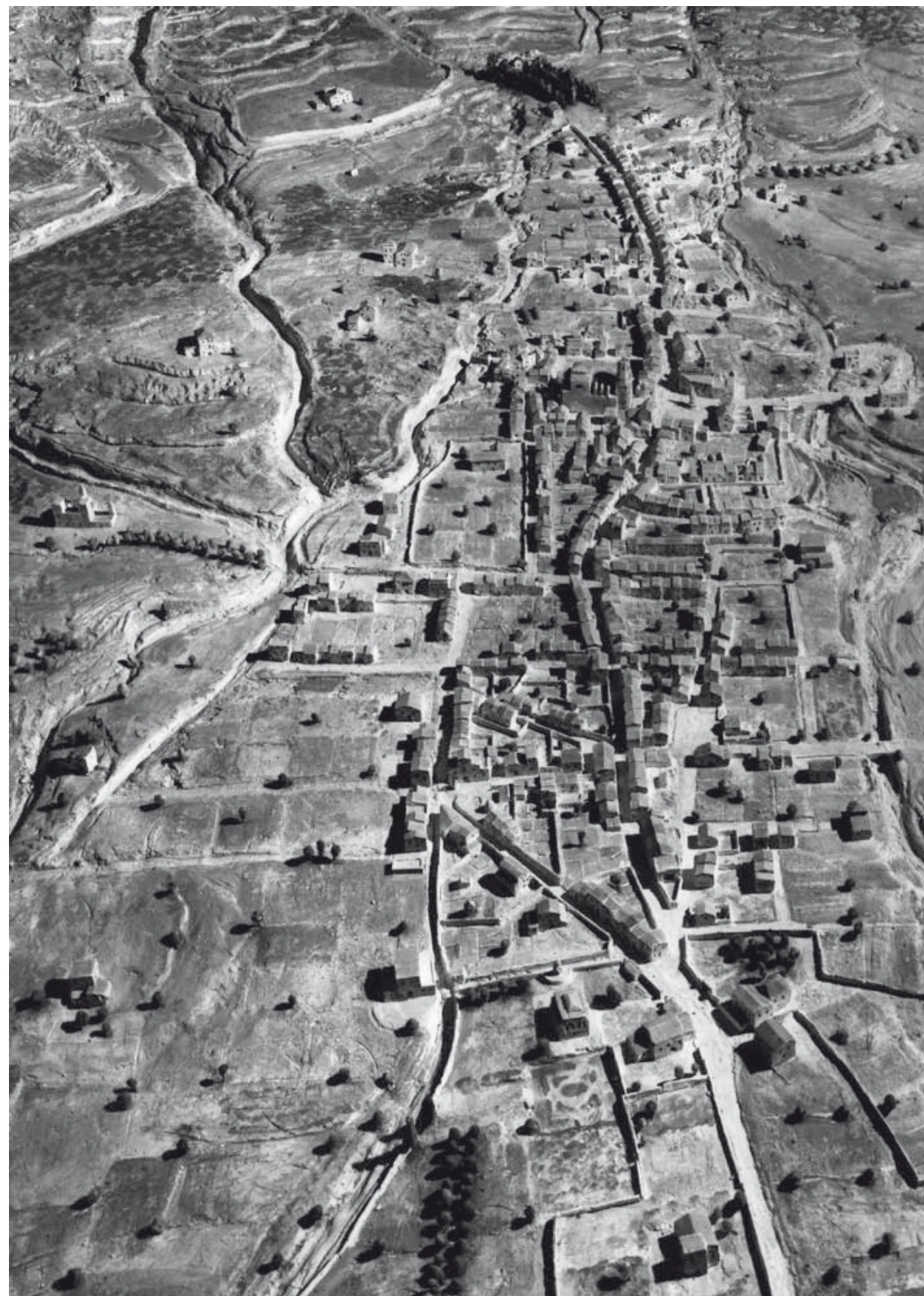
SARRIÀ 1850 Detall de la maqueta feta per Els Blaus l'any 1953, amb la part corresponent a la vila de Sarrià.